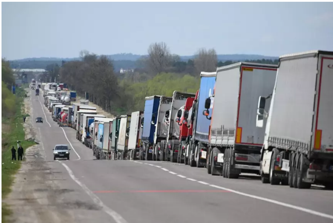
60% din cerealele ucrainene trec prin România.