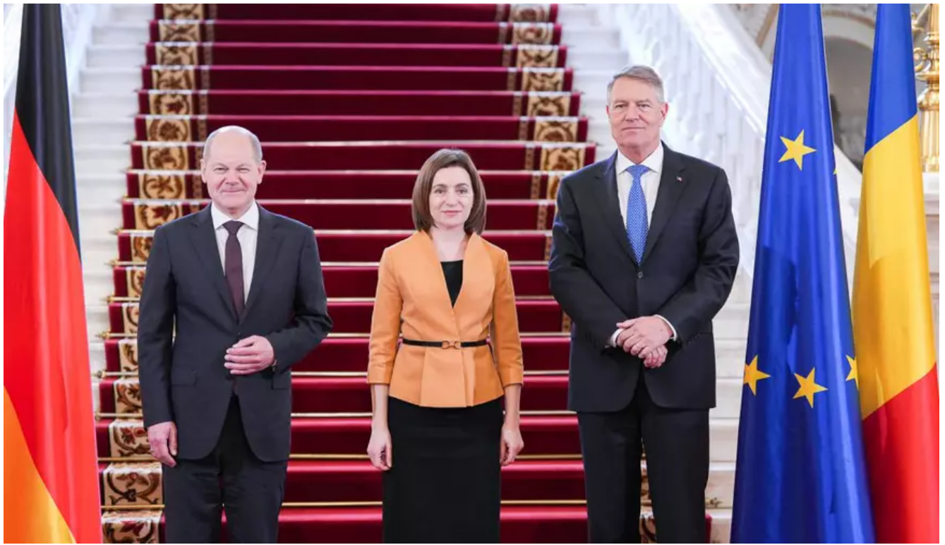
Primirea președintelui Republicii Moldova, Maia Sandu, la Palatul Cotroceni, alături de cancelarul Republicii Federale Germania, Olaf Scholz.