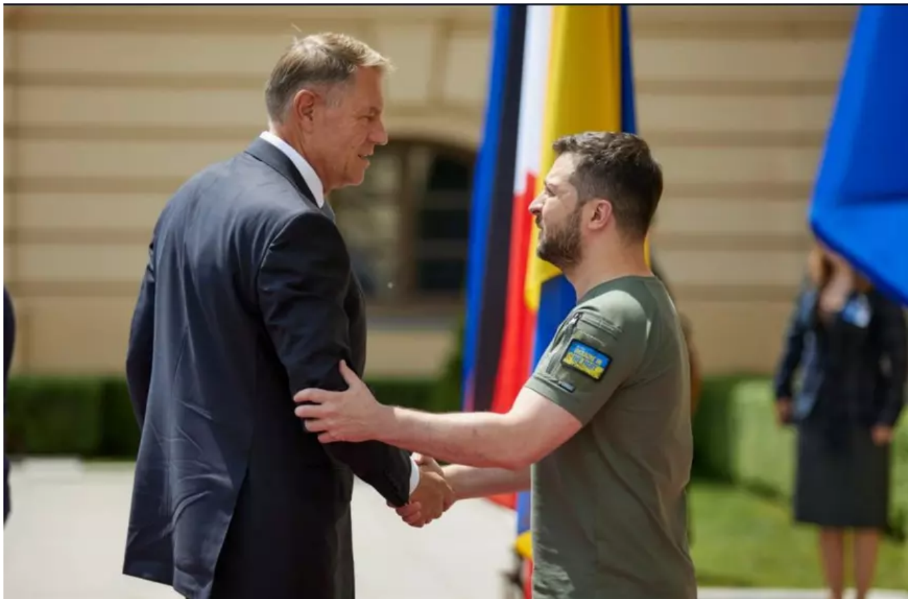
Klaus Iohannis și Volodimir Zelenski, în timpul vizitei efectuate de președintele român la Kiev, în iunie 2022.