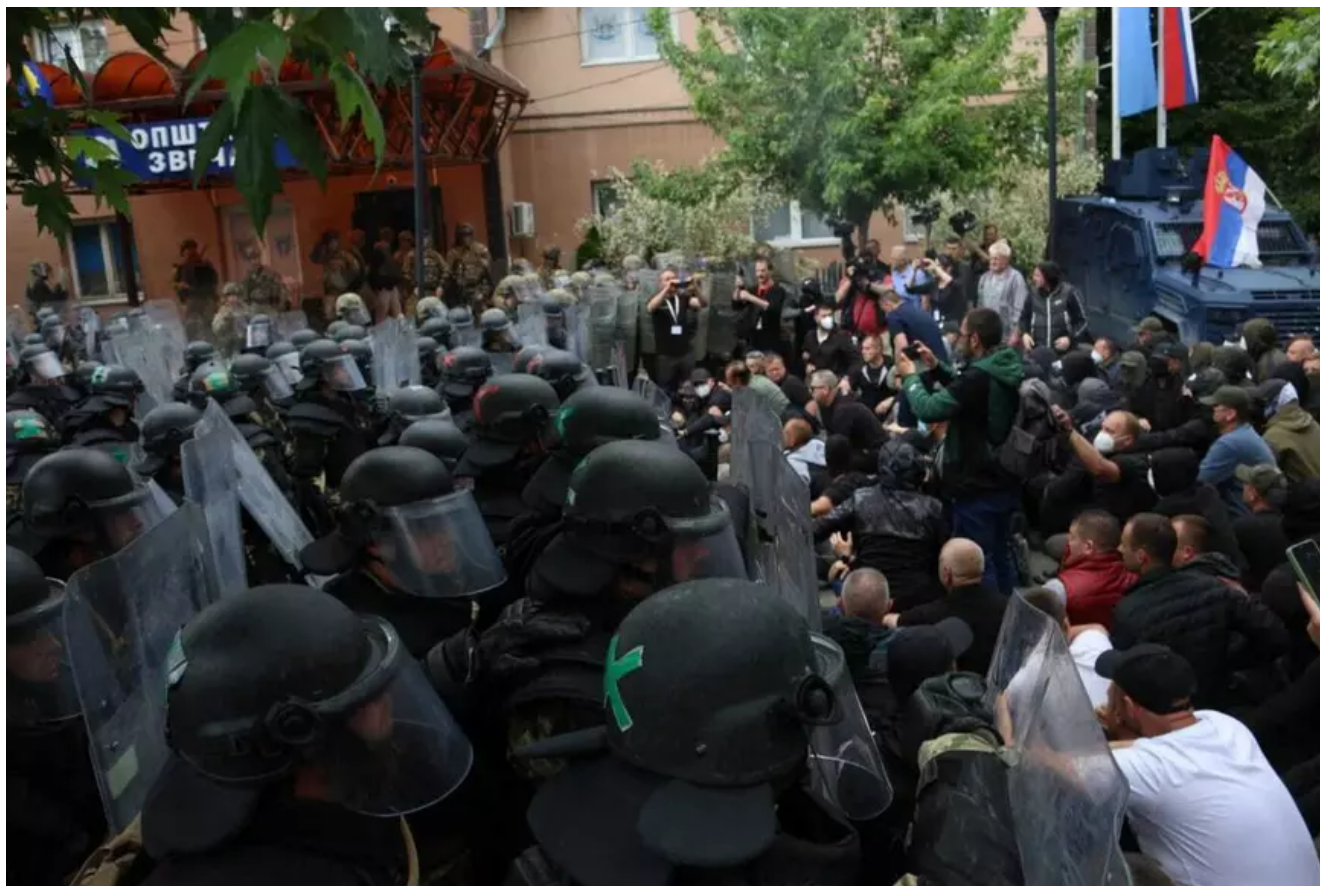
Forțele de ordine din Kosovo securizează accesul la o clădire municipală din Zvečan în timpul unui protest față de instalarea etnicilor albanezi în pozițiile de primari, 29 mai 2023.